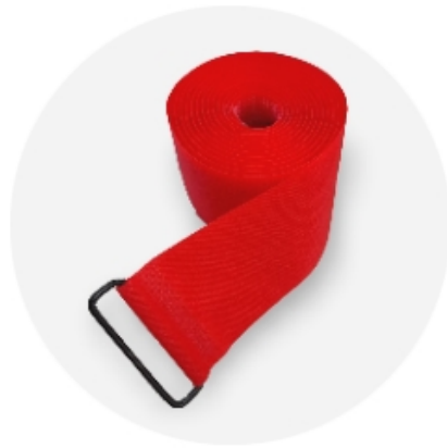
行李束帶 (實際提供款式，已現場發送為主)