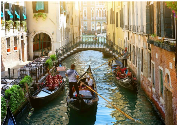
貢多拉遊船 安排5人搭乘一艘