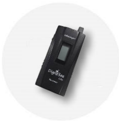
全程使用語音導覽耳機 聆聽講解更輕鬆 (如有損壞或遺失需照價賠償)