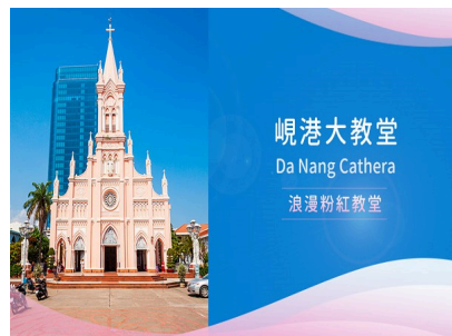
峴港大教堂 Da Nang Cathedral 浪漫粉紅教堂