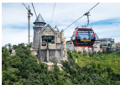
巴拿山_世界最長纜車