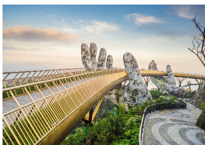
巴拿山_黃金佛手橋