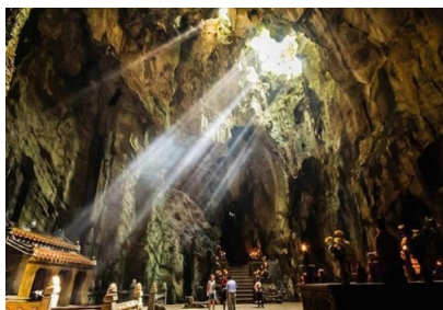
五行山Ngũ Hành Sơn