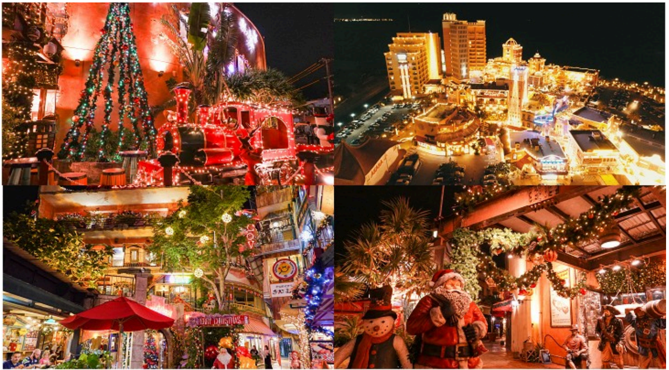
美國村點燈照片來自OCVP 官網授權，不得任意轉載